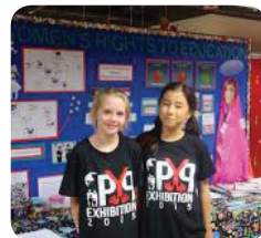
Élèves pendant l'exposition du PP

Pour les établissements et les élèves, l'exposition du PP constitue une excellente occasion de célébrer la transition vers l'étape suivante du parcours éducatif des apprenants.